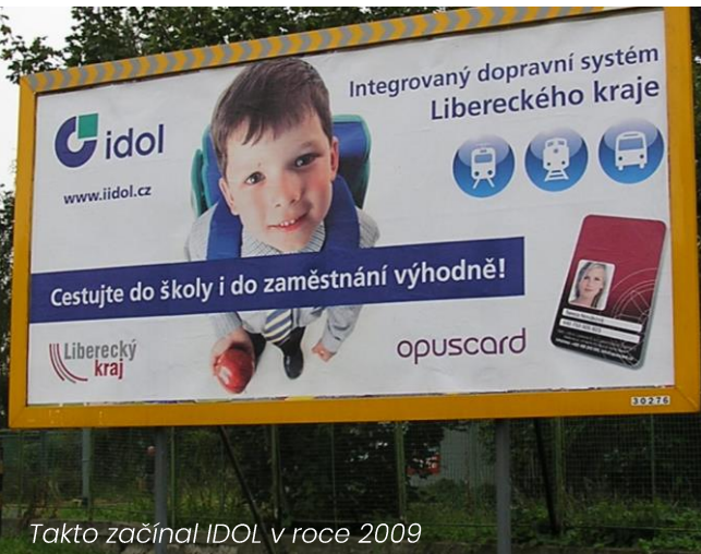
Takto začínal IDOL v roce 2009

Historii a vývoji se budeme více věnovat v některém z dalších dílů.